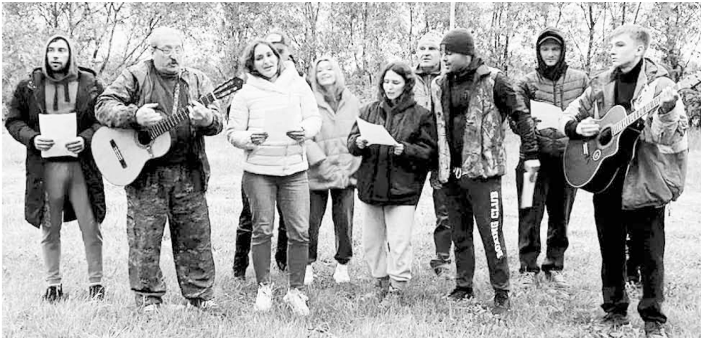
Конкурс туристской песни

Соревнования по дартсу проходили во второй день. Команда состояла из трех человек: двоих мужчин и одной женщины. Результат определялся по сумме очков, набранных при всех точных попаданиях в мишень. Кому-то повезло попасть в зоны удвоения и утроения очков... Победителем стала команда Павлоградской районной организации профсоюза.