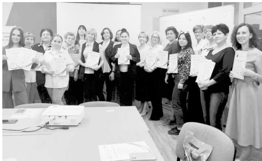
Все участники семинара получили сертификаты

В завершение семинара учитель иностранного языка гимназии №9, лауреат